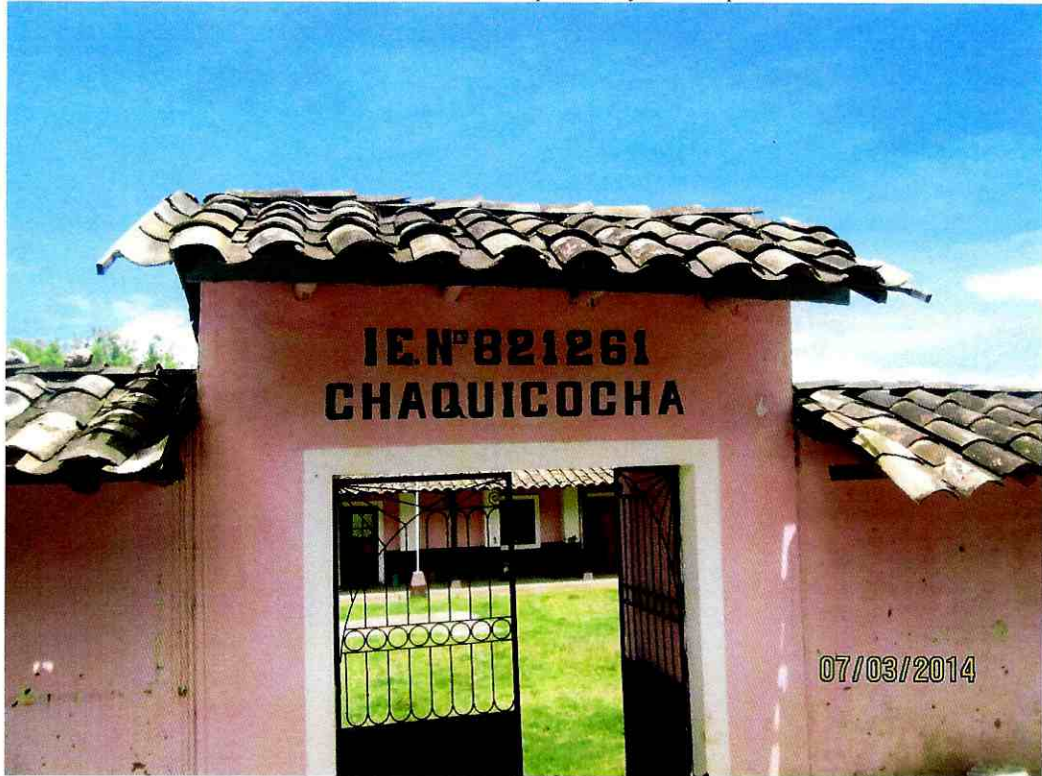
VIVIENDAS EN FORMA SEMI DISPERSA DEL C.P. CHAQUICOCHA

"Año de la Promoción de la Industria Responsable y del Compromiso Climático"