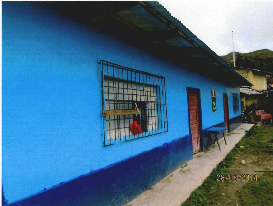
CASA COMUNAL DE USOS MULTIPLES DEL C.P. LA LECHUGA

"Año de la Promoción de la Industria Responsable y del Compromiso Climático" I.E.P. N° 821164 DEL C.P. LA LECHUGA