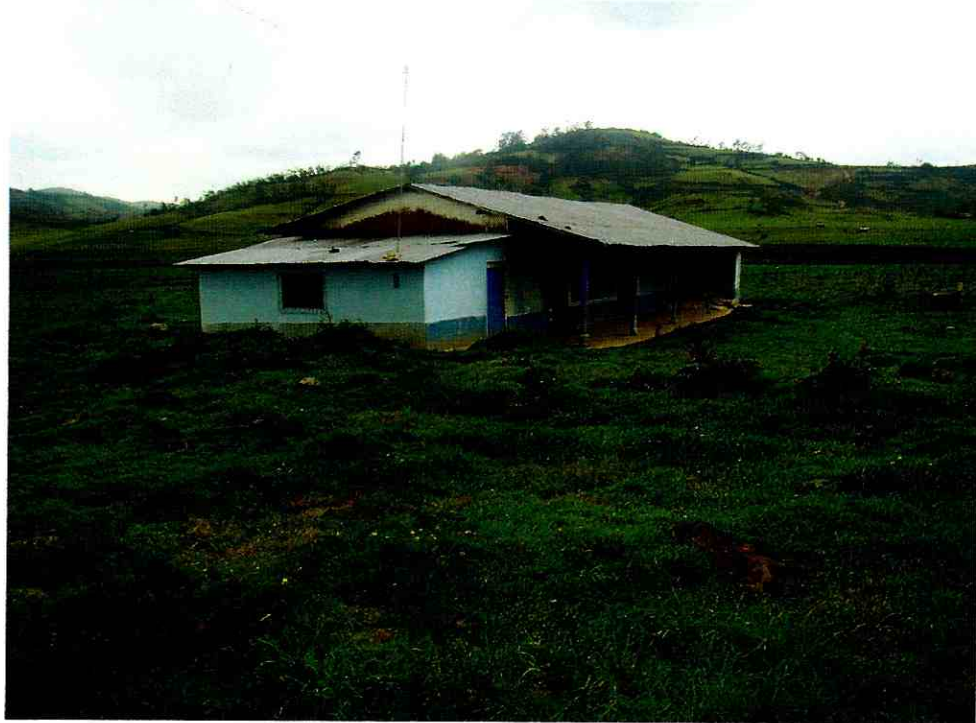
CENTRO DE NIVEL INICIAL SAN JUAN DE TINGAT

"Año del Centenario de Machu Picchu Para el Mundo"