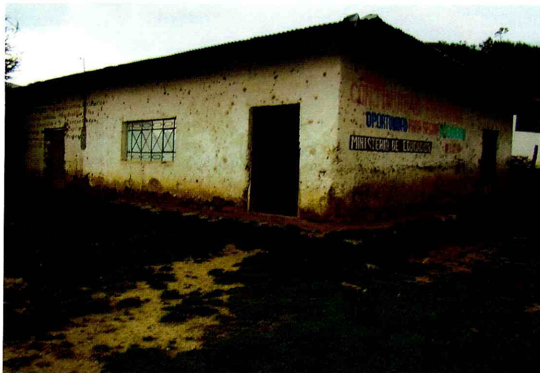
CENTRO COMUNAL MULTIUSOS SAN JUAN DE TINCAT