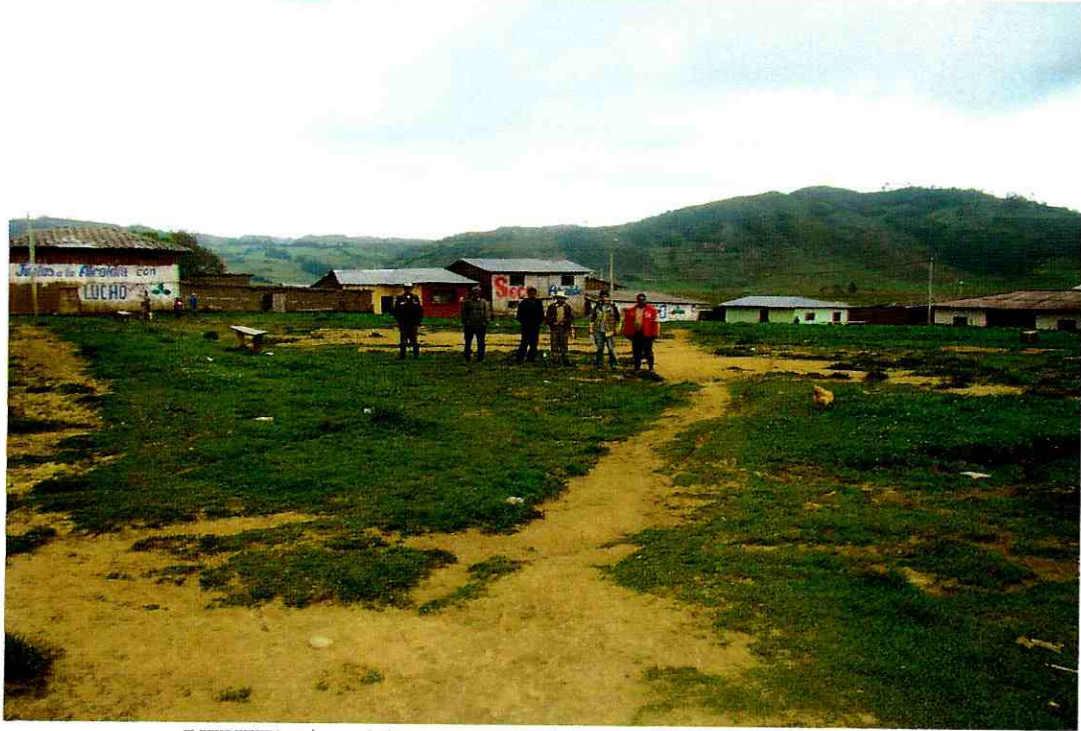
VIVIENDA CONTINUAS SAN JUAN DE TINCAT

"Año del Centenario de Machu Picchu Para el Mundo"