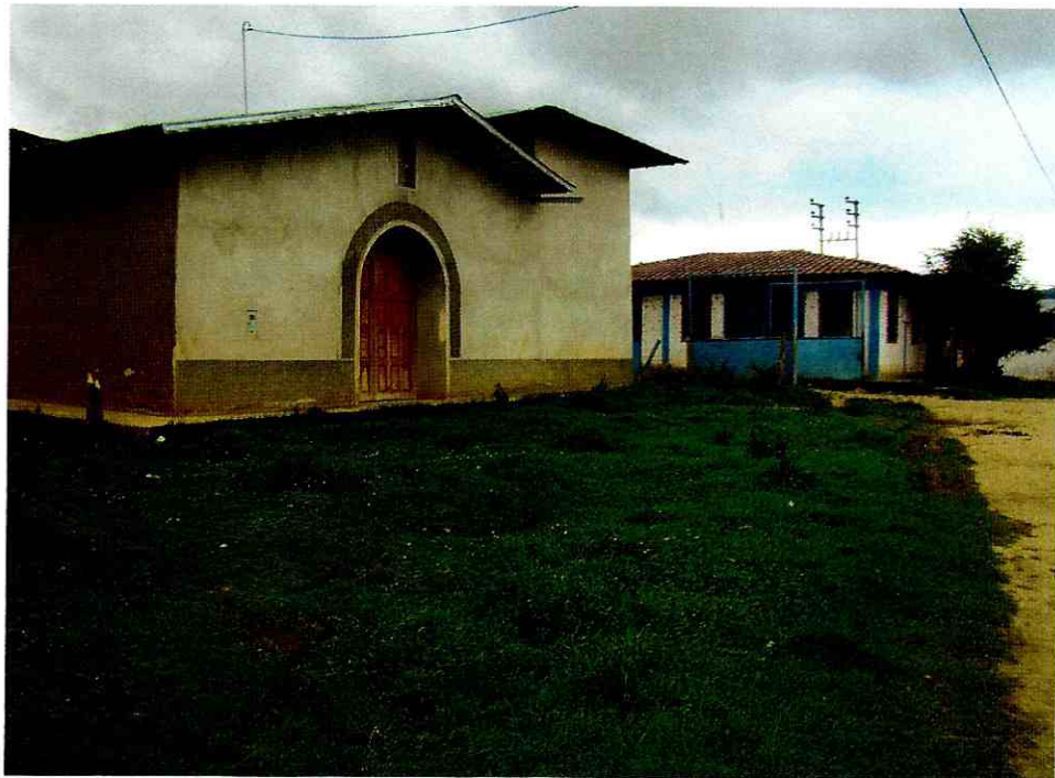
VISTA PANORAMICA SAN JUNA DE TINGAT