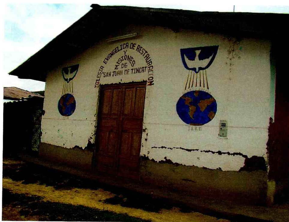
IGLESIA EVANGELICA SAN JUAN DE TINCAT