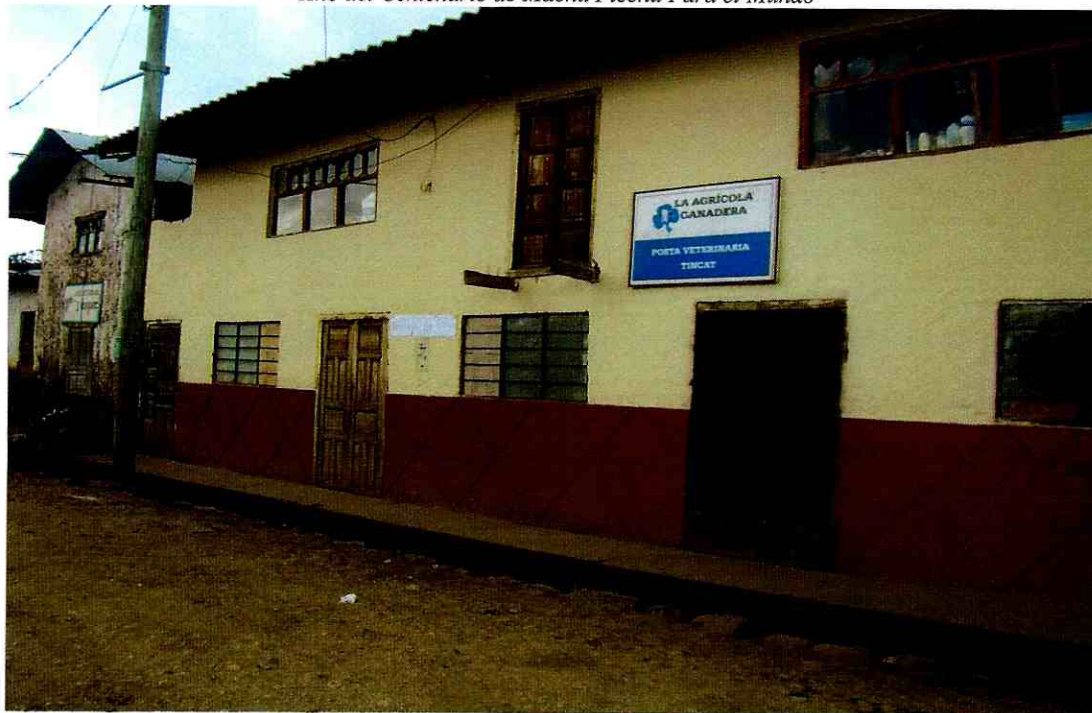
POSTA VETERINARIA SAN JUAN DE TINCAT

"Año del Centenario de Machu Picchu Para el Mundo"