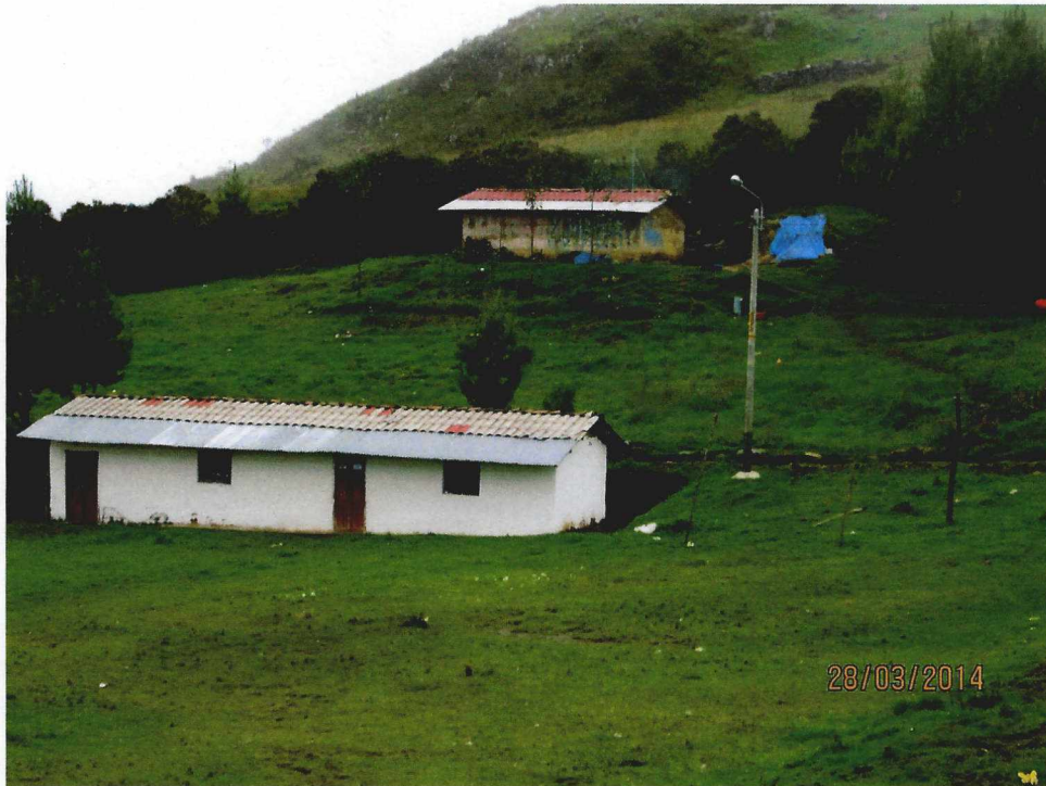
PRODUCCION AGRICOLA DEL C.P. SAN PEDRO

"Año de la Promoción de la Industria Responsable y del Compromiso Climático" CASA COMUNAL DE USOS MULTIPLES DEL C.P. SAN PEDRO