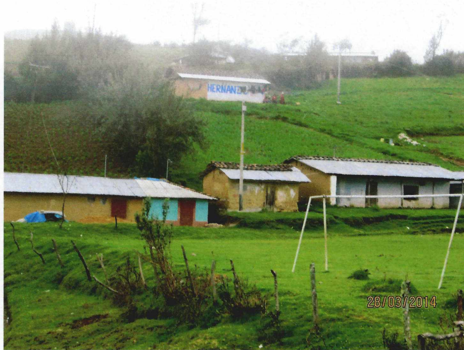
I.E.P. N°82257 DEL C.P. SAN PEDRO

VIVIENDAS EN FORMA AGRUPADA DEL SECTOR NORTE DEL C.P. SAN PEDRO