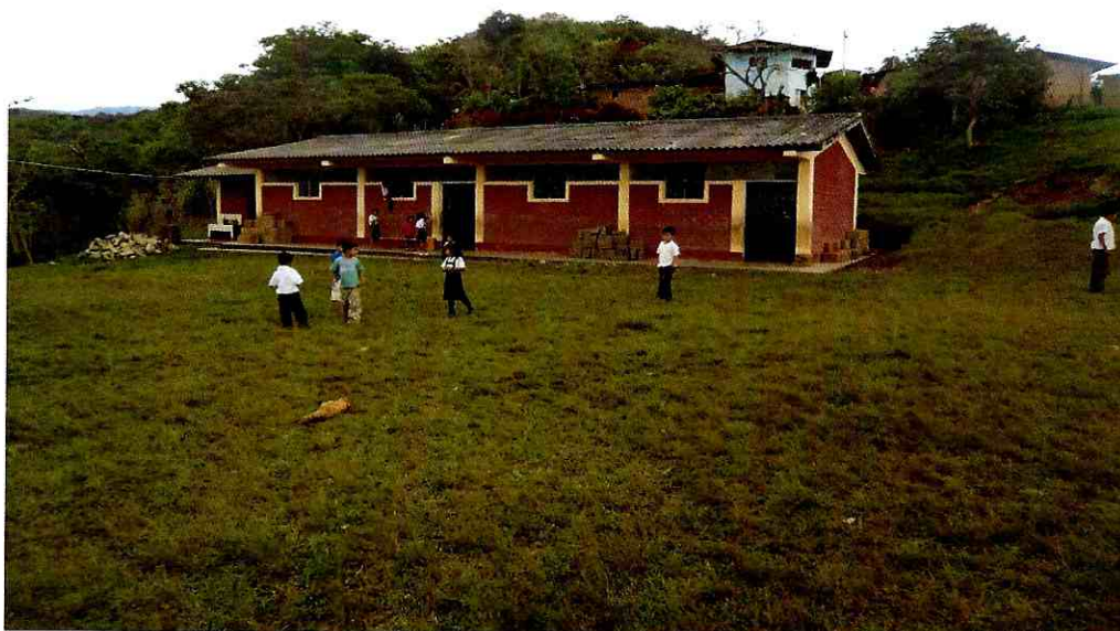
VIVIENDAS AGRUPADAS DEL SECTOR OESTE DEL C.P. BUENOS AIRES

"Año de La Inversión para el Desarrollo Rural y La Seguridad Alimentaria" I.E.I. DEL C.P. BUENOS AIRES