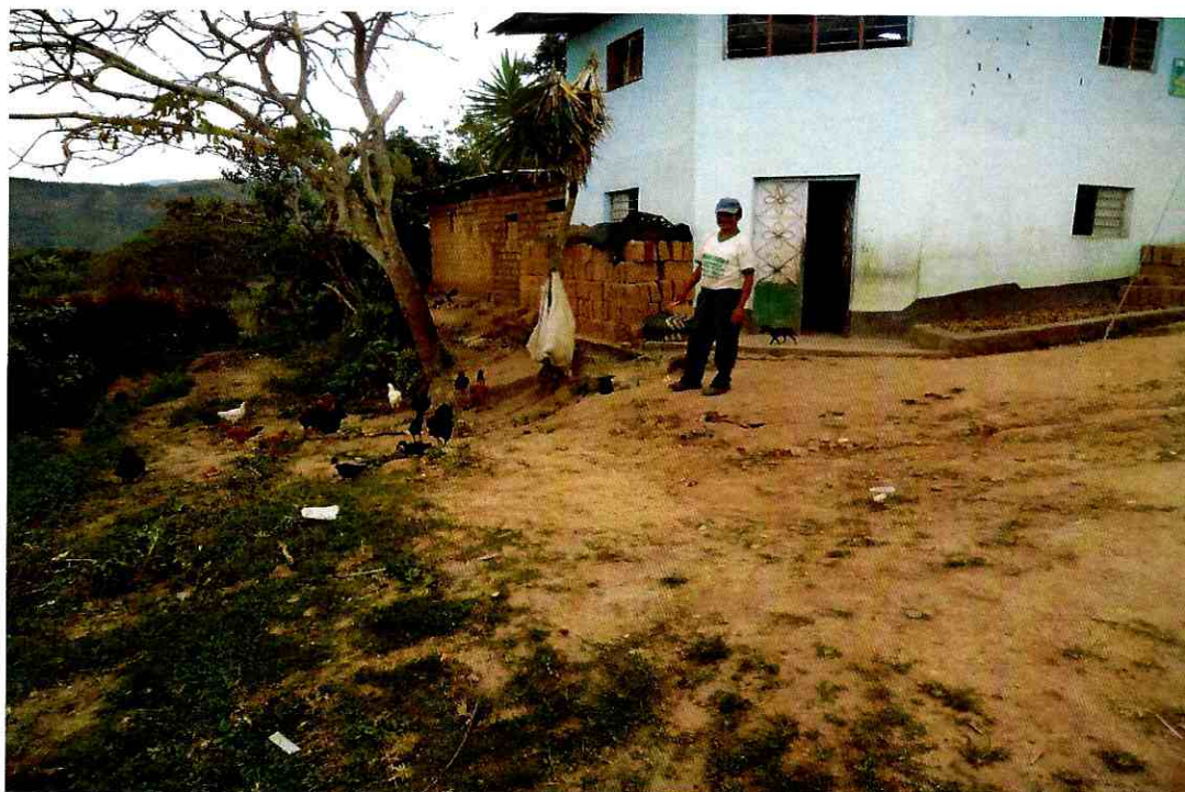
VIVIENDAS EN FORMA CONTINUA DEL SECTOR OESTE C.P. BUENOS AIRES

"Año de La Inversión para el Desarrollo Rural y La Seguridad Alimentaria" CRIANZA DE ANIMALES MENORES DEL C.P. BUENOS AIRES