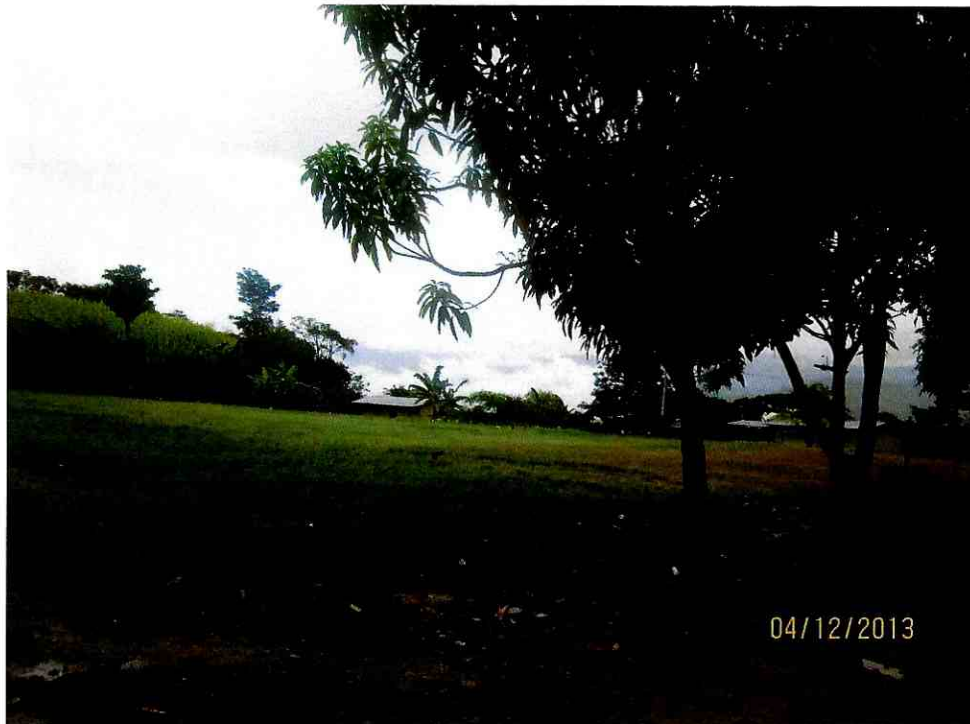
PRODUCCION AGRICOLA DEL C.P. EL ORIENTE

"Año de la Promoción de la Industria Responsable y del Compromiso Climático" VIVIENDAS AGRUPADAS DEL SECTOR ESTE DEL C.P. EL ORIENTE