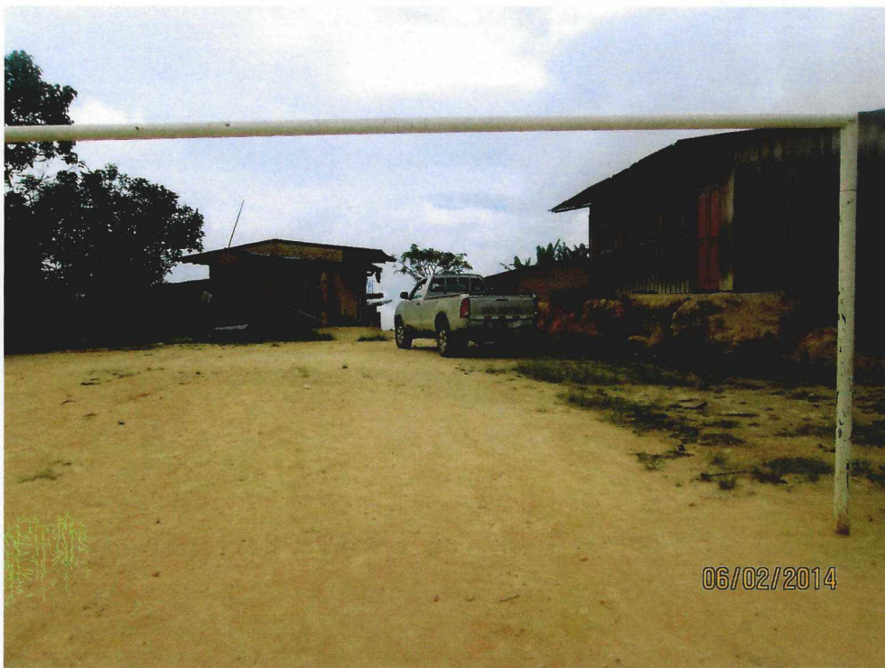
CASA COMUNAL DE USOS MULTIPLES DEL C.P. EL PROGRESO

VIVIENDAS EN FORMA AGRUPADA DEL SECTOR SUR C.P. EL PROGRESO