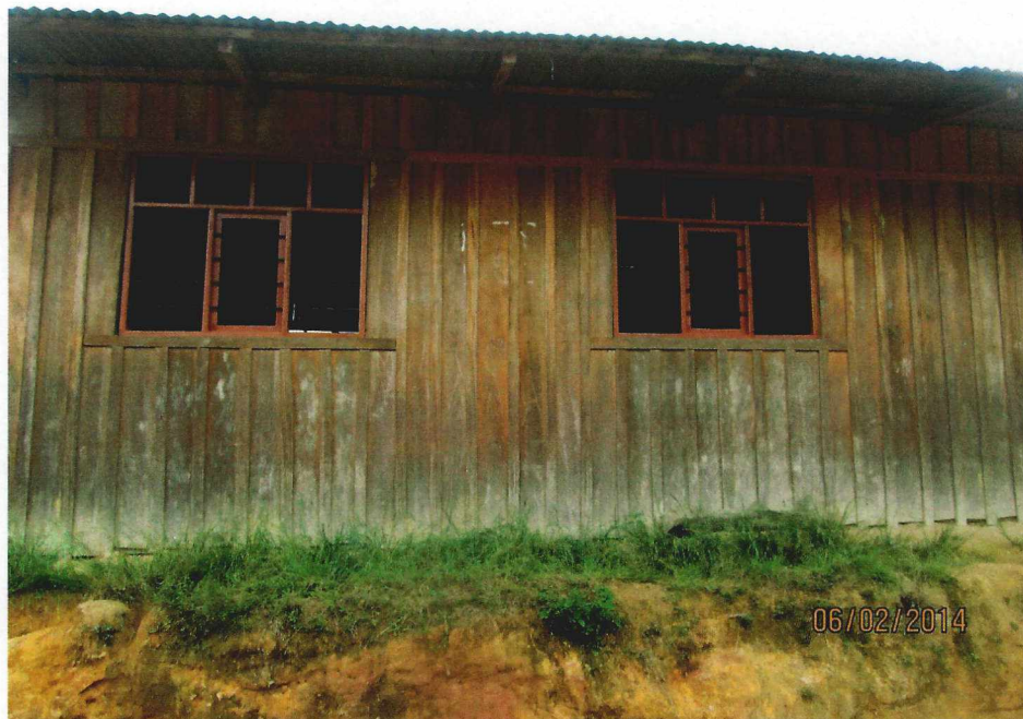
VIVIENDAS EN FORMA CONTINUA DEL C.P. EL PROGRESO

"Año de la Promoción de la Industria Responsable y del Compromiso Climático"