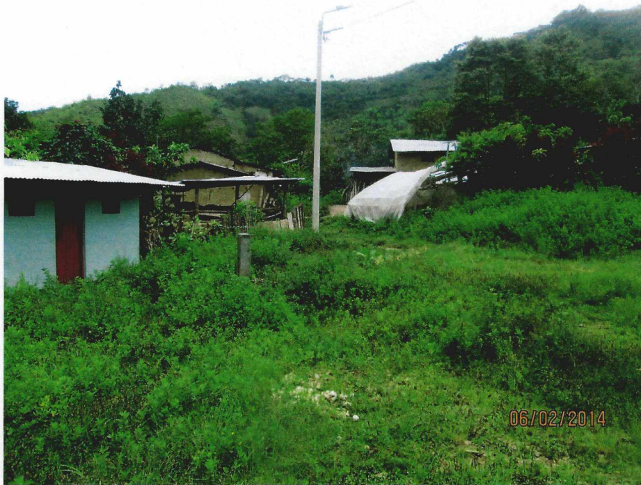
PRONOEI DEL C.P. JUAN ALBACETI

VIVIENDAS EN FORMA CONTINUA DEL SECTOR SUR DEL C.P. JUAN ALBACETI