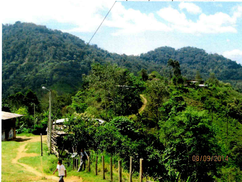
PRODUCCUION AGRICOLA DEL C.P. NUEVO PARAISO EL CHAUPE

"Año de la Promoción de la Industria Responsable y del Compromiso Climático"