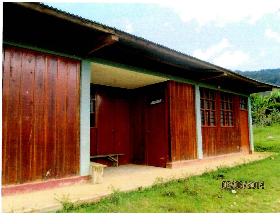
VIVIENDAS EN FORMA CONTINUA DEL SECTOR SUR DEL C.P. NUEVO PARAISO EL CHAUPE

"Año de la Promoción de la Industria Responsable y del Compromiso Climático" BOTIQUIN COMUNAL DEL C.P. NUEVO PARAISO EL CHAUPE