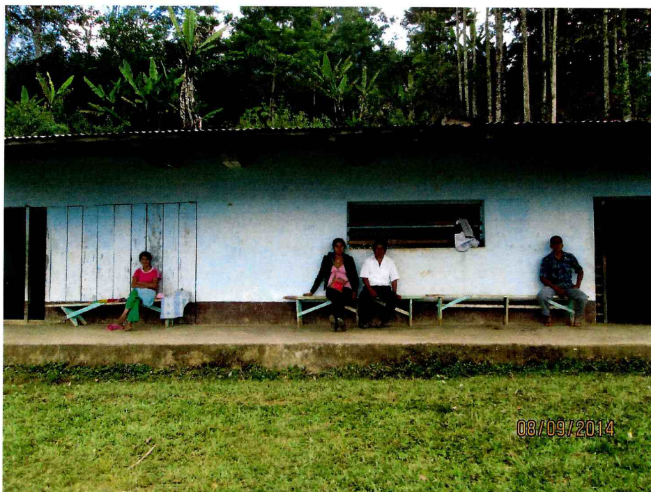
VIVIENDAS EN FORMA CONTINUA DEL SECTOR OESTE DEL C.P. NUEVO PARAISO EL CHAUPE

"Año de la Promoción de la Industria Responsable y del Compromiso Climático" PRONOEI DEL C.P. NUEVO PARAISO EL CHAUPE