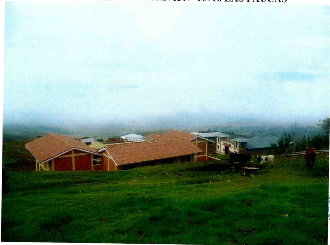
VIVIENDAS CONTINUAS DEL CENTRO POBLADO LAS PAUCAS