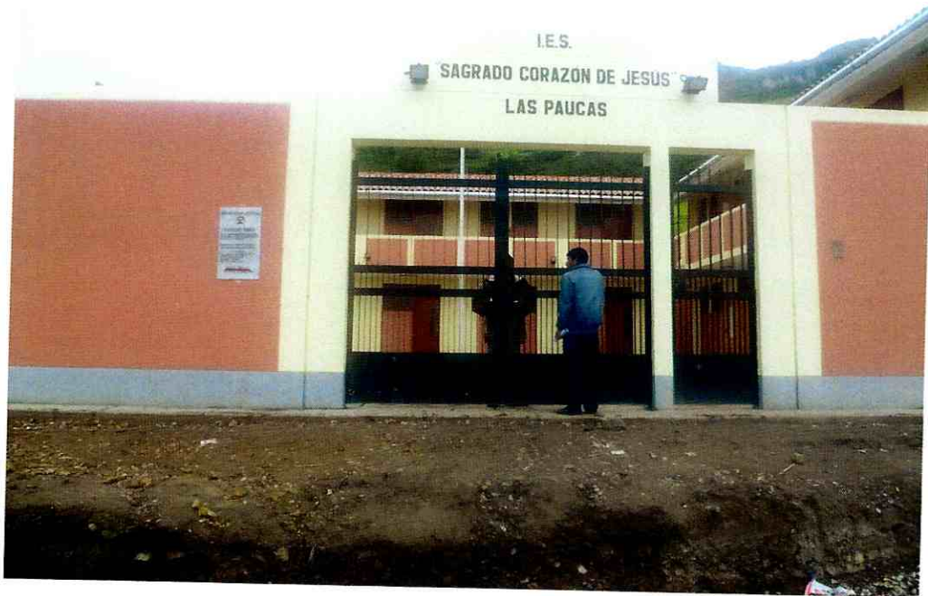
COLEGIO SECUNDARIO SAGRADO CORAZON DE JESU LAS PAUCAS

"Año del Centenario de Machu Picchu para el Mundo"