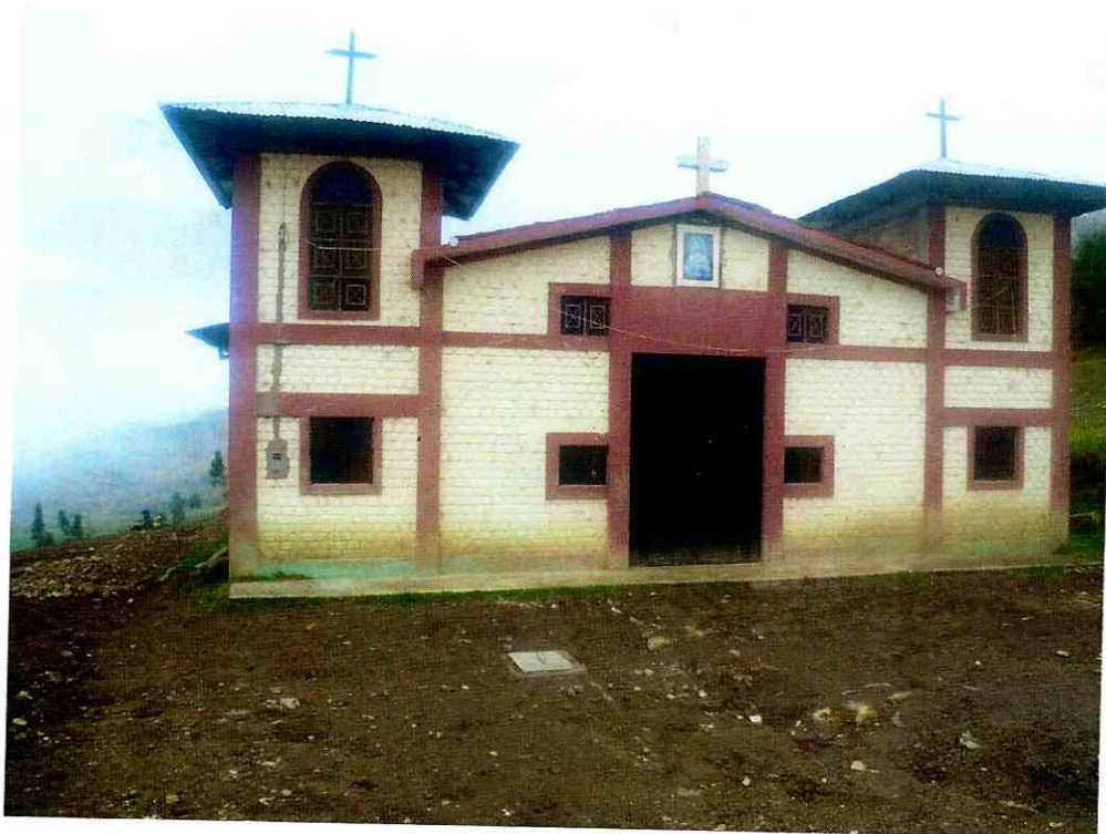
IGLESIA LAS PAUCAS