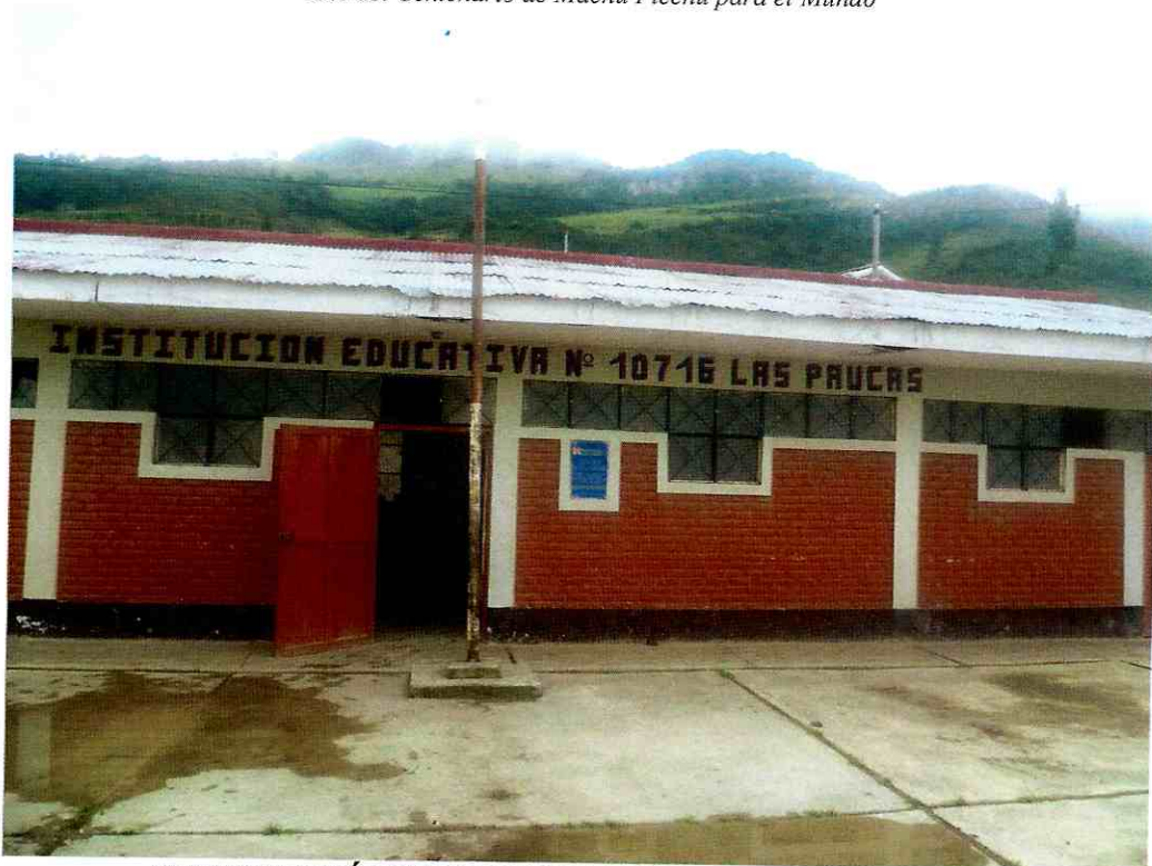
INSTITUCIÓN EDUCATIVA N° 10716 LAS PAUCAS

"Año del Centenario de Machu Picchu para el Mundo"